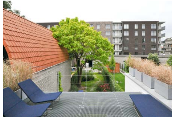
Het dakterras bestaat uit gegalvaniseerd metaal: het biedt ruimte tot ontspannen en laat tegelijkertijd voldoende licht door voor de woonruimtes op het gelijkvloers.