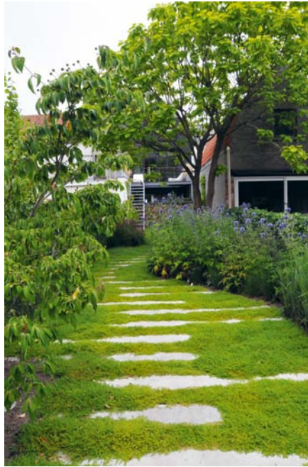
Een klassiek pad zou de tuin optisch laten versmallen: met de stapstenen kun je dat vermijden