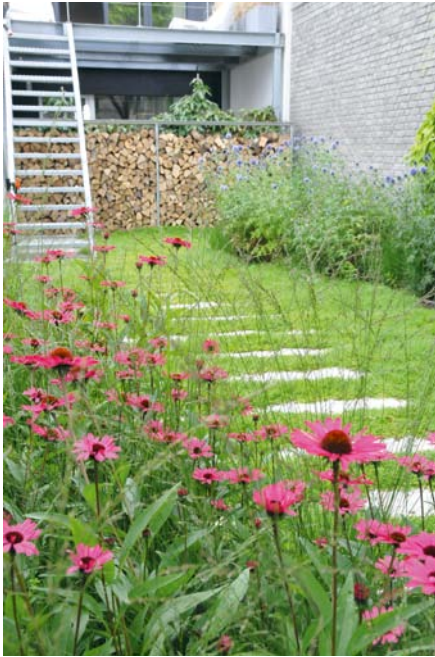
De purperen zonnehoed tussen het ranke siergras creëert een fascinerend schouwspel.