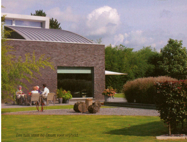
Een tuin staat bij Otium voor vrijheid.